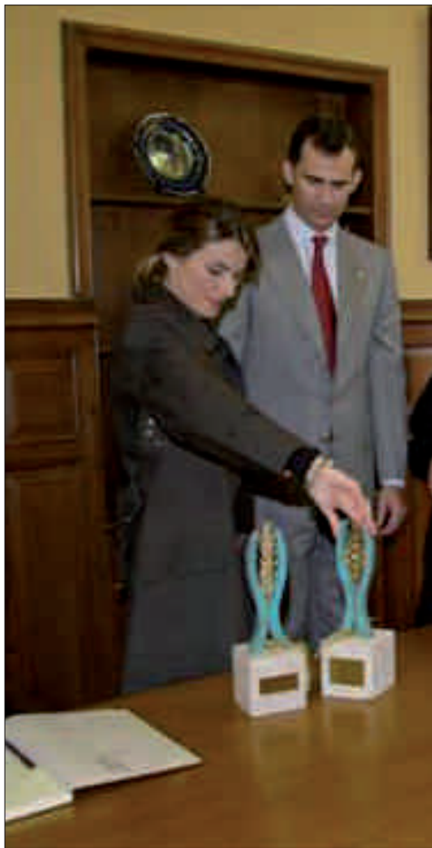
Autor de las esculturas: J. E. Pinín